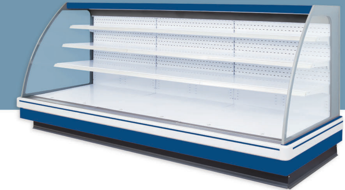
• Shock-resistance plastic bumper